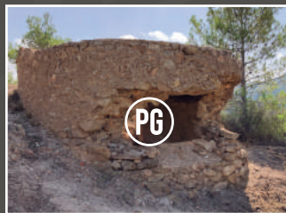
PUNTAL DEL GORDO

El caseriu de Xinquèr, d'origen àrab, va ser evacuat durant la Guerra Civil Espanyola i abandonat definitivament després del conflicte, quedant congelat en el temps.