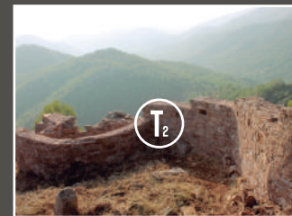
SEGUNDA "TETA" (NORTE)

Este tossal o "Mamella" es va mantindre en poder republicà fins al final de la Guerra; encara és possible descobrir el seu sistema defensiu de trinxeres excavades en la roca.