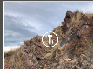
PRIMERA "TETA" (SUR)